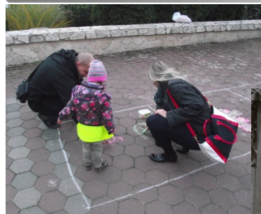
Detské popoludnie, maľby, policajti, súťaže